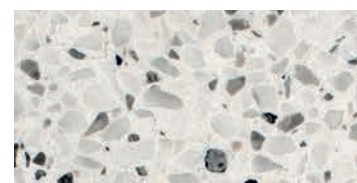
levigato / honed / geschliffen