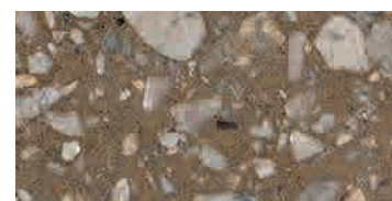
levigato / honed / geschliffen